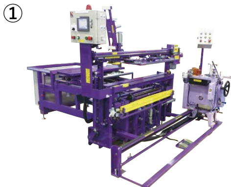
表張・框縫付自動片框裁断機 マルチロボット KTII