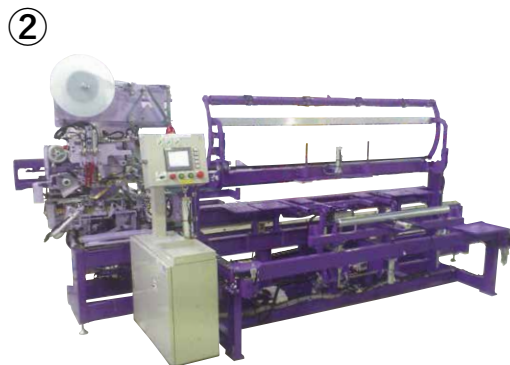
表全自動平刺・返縫機 両用ロボット Victory