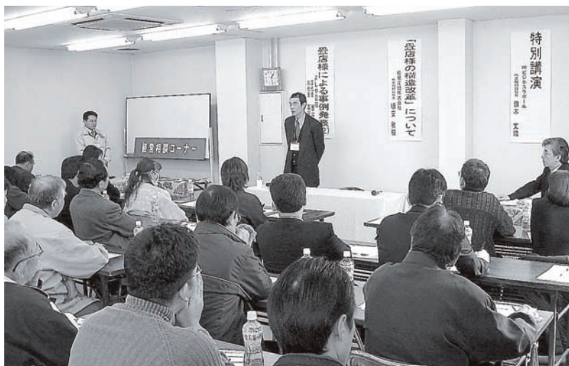
事例発表 よしや畳店様 (2月19日北関東営業所2階セミナールームにて)

発行／極東産機株式会社 ☎679-4195 たつの市龍野町日飼190 ☎(0791)62-1771 編集／極東産機(株) 総務部 ホームページアドレス http://www.kyokuto-sanki.co.jp